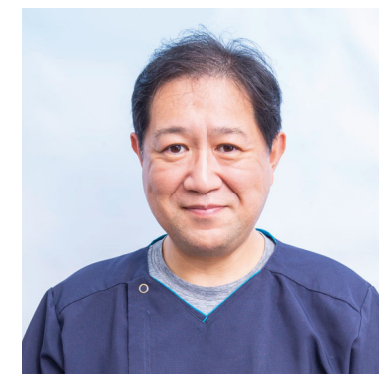
医療連携部長 兼 心臓血管外科診療技術教育部長 兼 リハビリテーション部長

当院としては、これまで以上に地域からの紹介患者さんを中心とした診療に注力いたします。そのためには、状態の安定した患者さんや飛び込みで来院される患者さんの初期診療について、ご相談させていただく機会が増えるかと思えます。日頃より多くの患者さんを診られている中でのご相談になり大変恐縮ではありますが、何卒ご協力いただけますと幸いです。また、当院としてできることがあればいつでもご遠慮無くご連絡いただければと思います。引き続きどうぞよろしくお願いいたします。